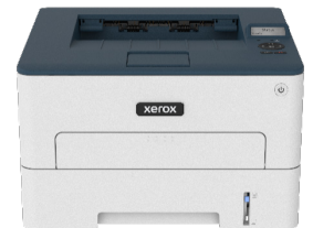
מדפסת Xerox® B230