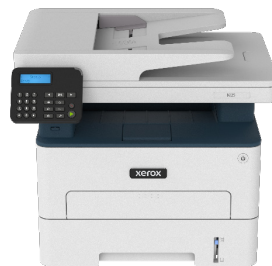
Xerox® B225 Multifunction