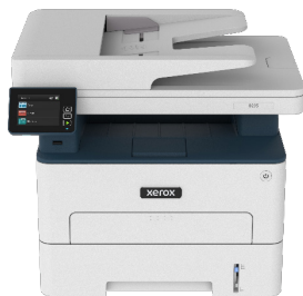
מדפסת Xerox® B235 Multifunction